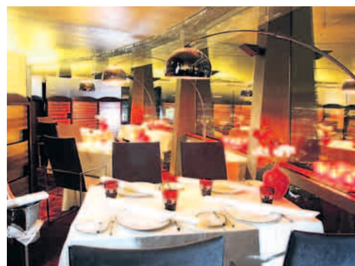
In luftigen Höhen: Im Oktober 2009 übernahm Koch das Restaurant „181 first“ im Münchner Olympiaturm

Geschäft, mit hohen Personal- und Einkaufskosten. Nicht umsonst entstehen heute Gourmetrestaurants mit hohem Anspruch vornehmlich an Luxushotels angegliedert, die die Verluste der Gastronomie gegen die Werbungskosten des Hotels rechnen können. Nach anfänglichem Erfolg im „Le Gourmet“ war Koch mit seinem Restaurant in die Münchner Innenstadt umgezogen und hatte zusätzlich die Verantwortung für das auf gehobene bayerische Küche spezialisierte Restaurant „Schwarzwälder“ im gleichen Gebäude unweit des Promenadenplatzes übernommen. Bei einer auf 60 Angestellte angeschwollenen Belegschaft reicht in München schon ein besonders warmer Sommer, um einen Gastronomen, der mit keinem Biergarten locken kann, in ernsthafte Schwierigkeiten zu manövrieren.