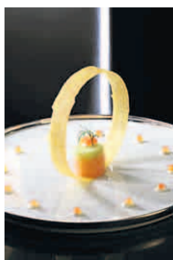
Amuse-Gueule: Tatar von Biolachs mit Kartoffelkranz