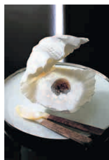
Schwarze Perle vom Kaspischen Meer: Sevruga-Kaviar in Gelee